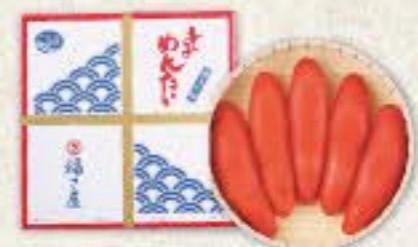
辛子めんたい (240g) 冷蔵 8k 品番 1106 3,240円(税込) ●賞味期限:冷蔵14日