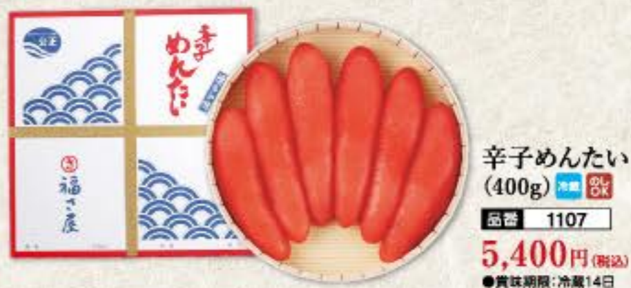
辛子めんたい (400g) 冷蔵 8k 品番 1107 5,400円(税込) ●賞味期限:冷蔵14日