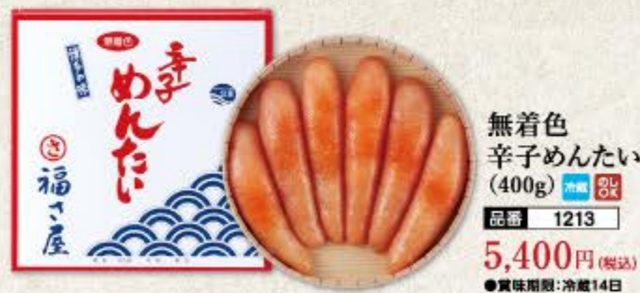
無着色 辛子めんたい (400g) 冷蔵 8k 品番 1213 5,400円(税込) ●賞味期限:冷蔵14日