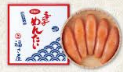
無着色辛子めんたい (240g) 冷蔵 8k 品番 1212 3,240円(税込) ●賞味期限:冷蔵14日