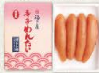
無着色辛子めんたい (135g) 冷蔵 8k 品番 1202 1,782円(税込) ●賞味期限:冷蔵14日