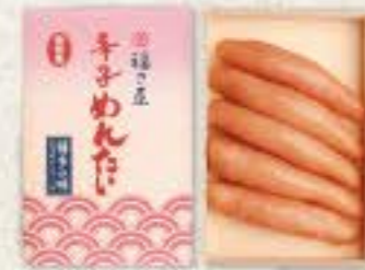
無着色辛子めんたい (180g) 冷蔵 8k 品番 1203 2,376円(税込) ●賞味期限:冷蔵14日