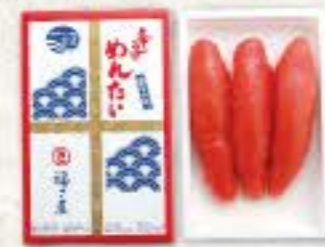
辛子めんたい (90g) 冷蔵 8k 品番 1101 1,188円(税込) ●賞味期限:冷蔵14日