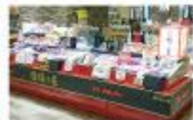
博多駅マイング店(福岡)

[福 岡] 清水工場直売所・博多飯急・博多デイトス店 [北九州] 北九州支店直売所・小倉駅アミューブラザ店 [大 阪] 大阪支店直売所・阪急うめだ本店 [東 京] 東京支店直売店