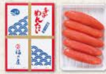
辛子めんたい (180g) 冷蔵 8k 品番 1103 2,376円(税込) ●賞味期限:冷蔵14日