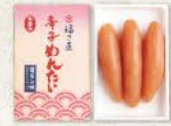
無着色辛子めんたい (90g) 冷蔵 8k 品番 1201 1,188円(税込) ●賞味期限:冷蔵14日