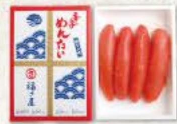
辛子めんたい (135g) 冷蔵 8k 品番 1102 1,782円(税込) ●賞味期限:冷蔵14日